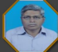
आय. क्यु. ए. सी. समन्वयक