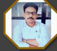
मराठी विभाग प्रमुख