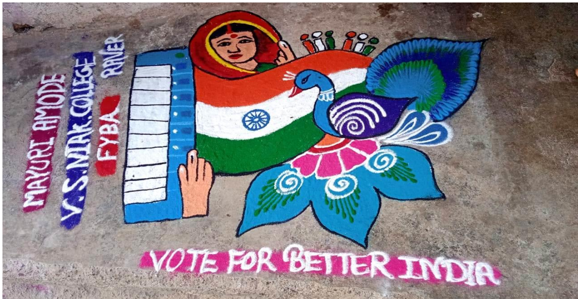
Rangoli Competition for Voter Awareness Program