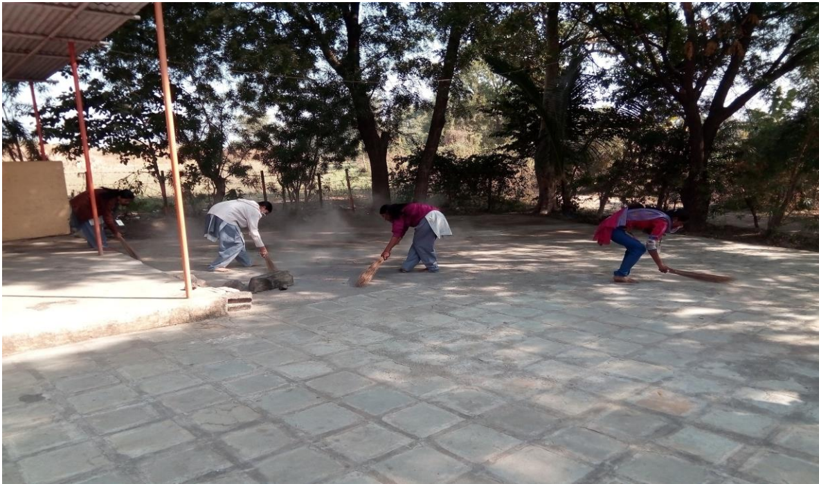
Social Responsibility Programme for Clean India