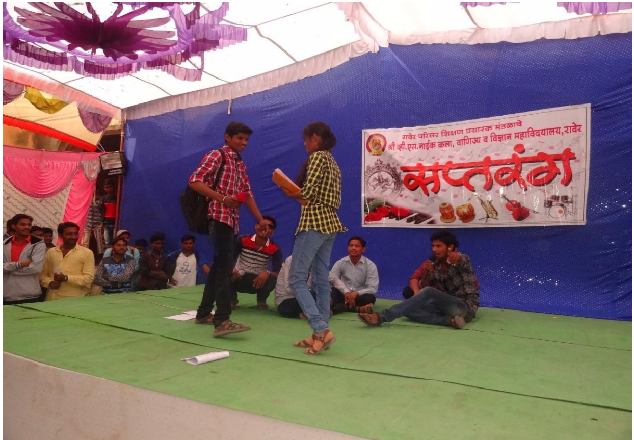
Social issue in Annual Gathering