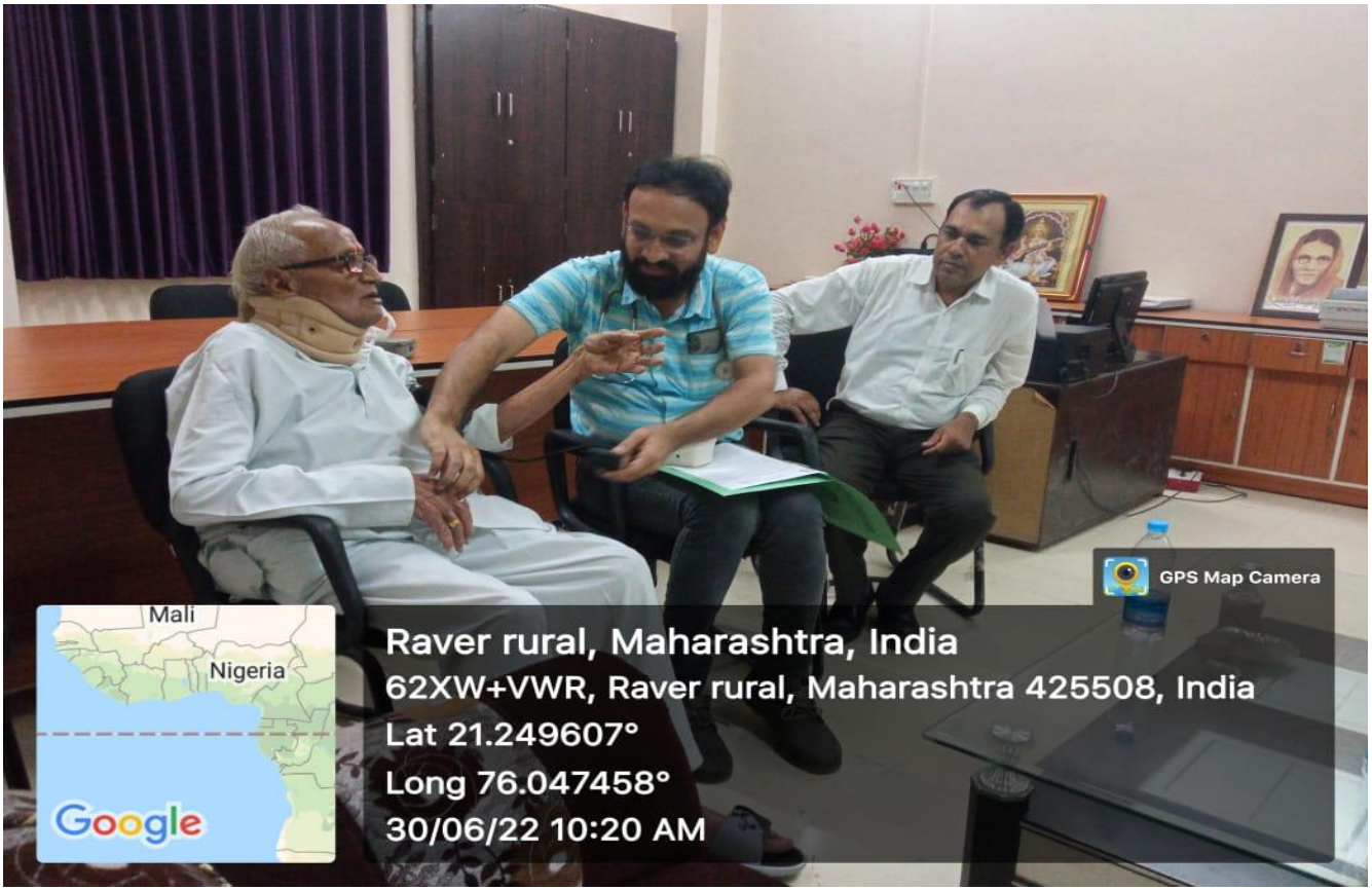
Institute Organized Medical Health checkup Camp