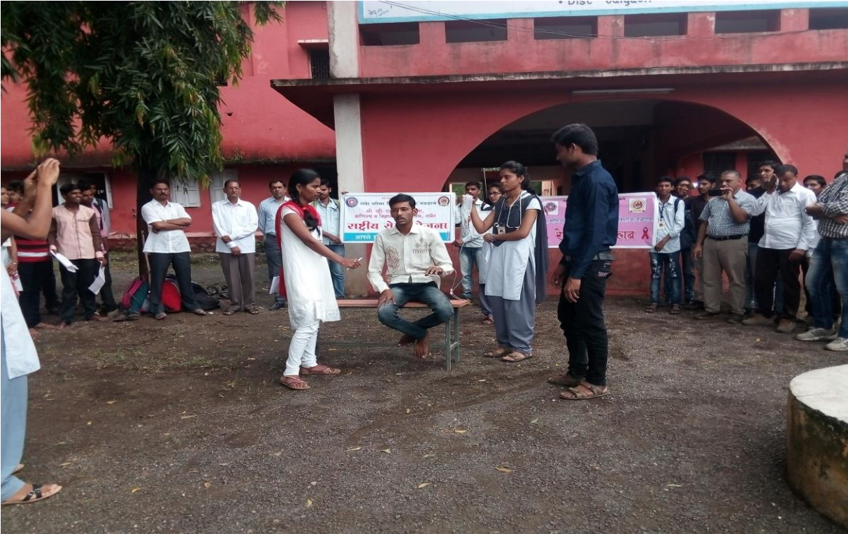
Students Delivered a Short Street Play on AIDS