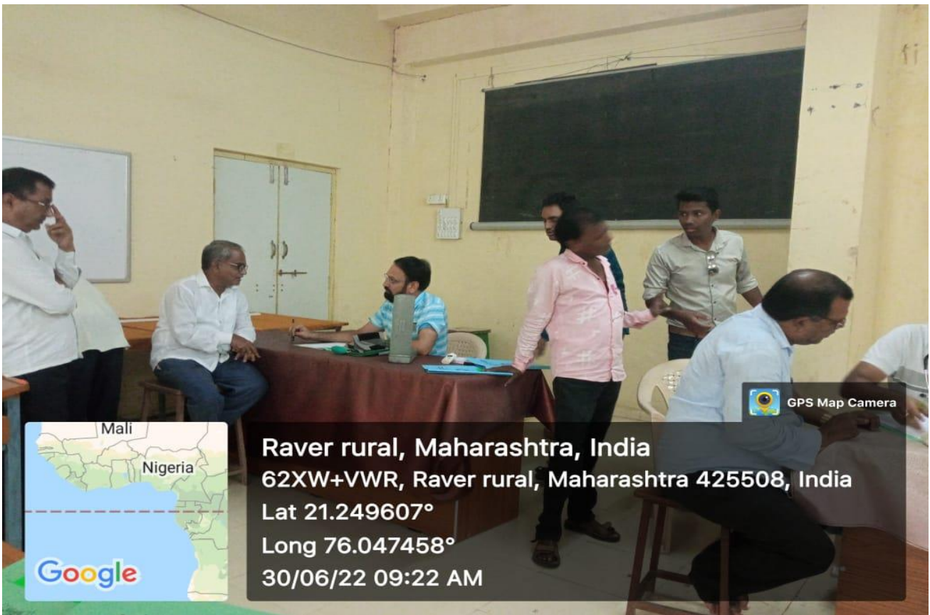
Teaching and Non-teaching Checking Health in the Medical Camp