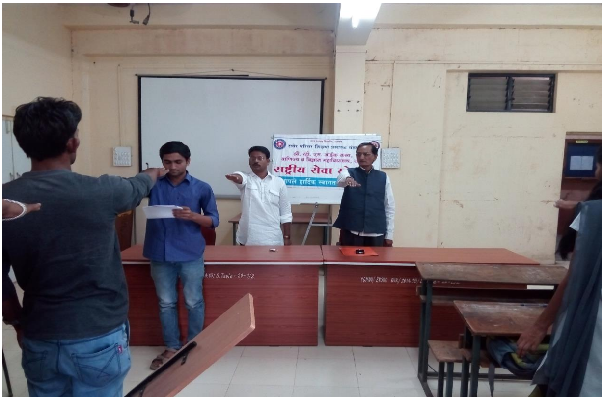
Institute organized Oath Programme on the Occasion of Constitution Day