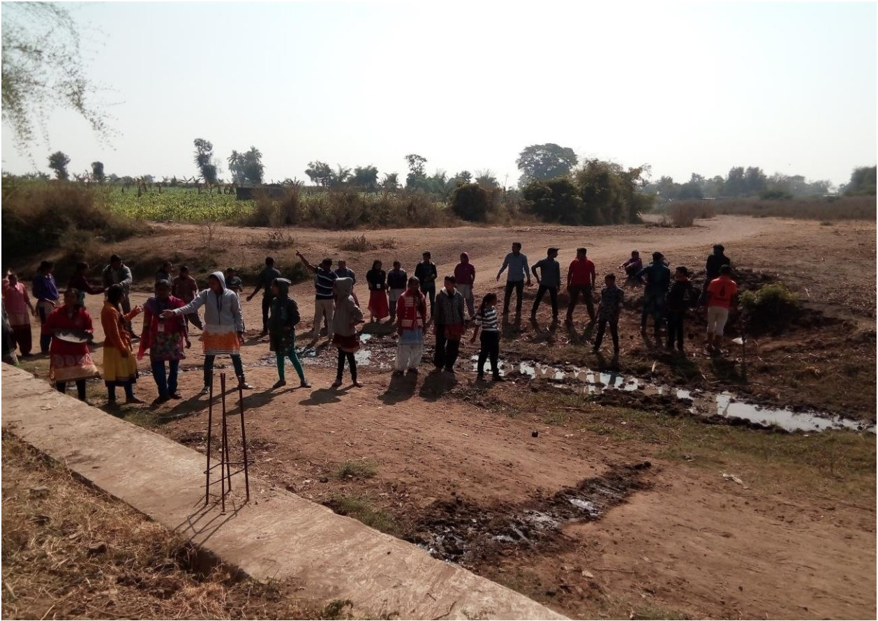
Shramdaan in NSS Adopted Village