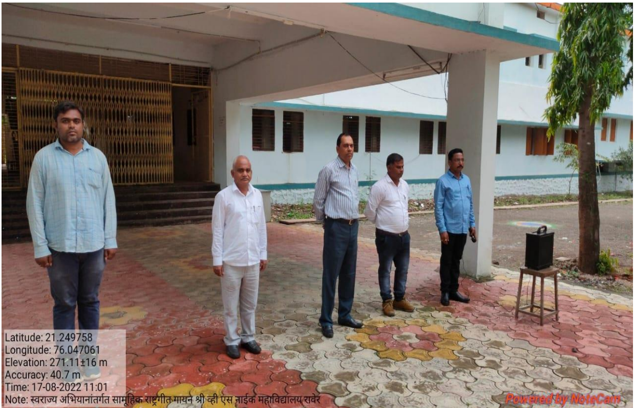
Institute organized Common National Anthem Programme