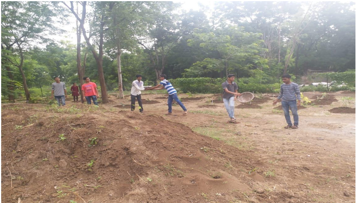
Students Participated in Social Activity in the College Premises