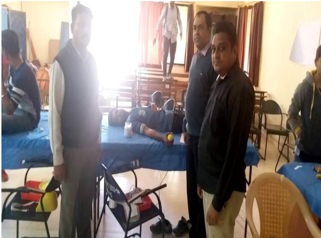
Students Donating Blood in Blood Donation Camp