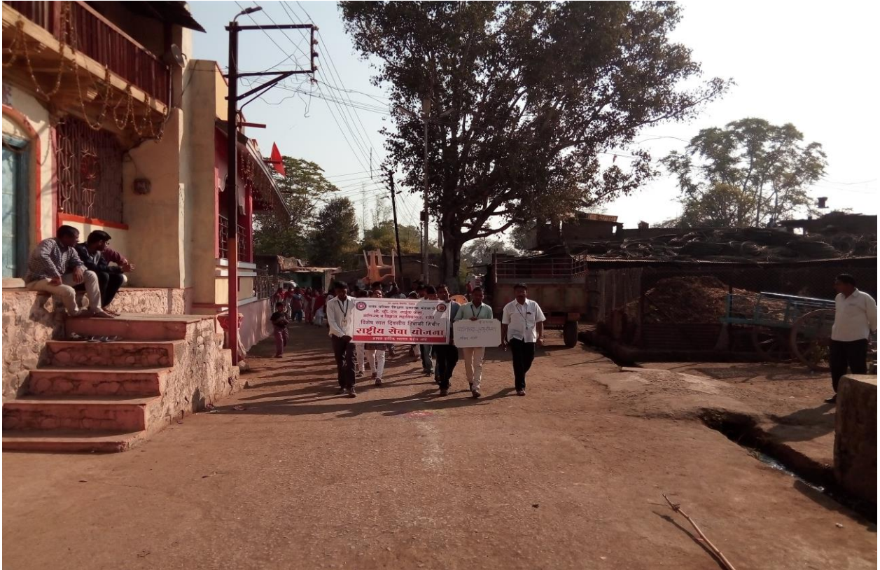
Institute Organized Rally in Village to Promote Voter Awareness