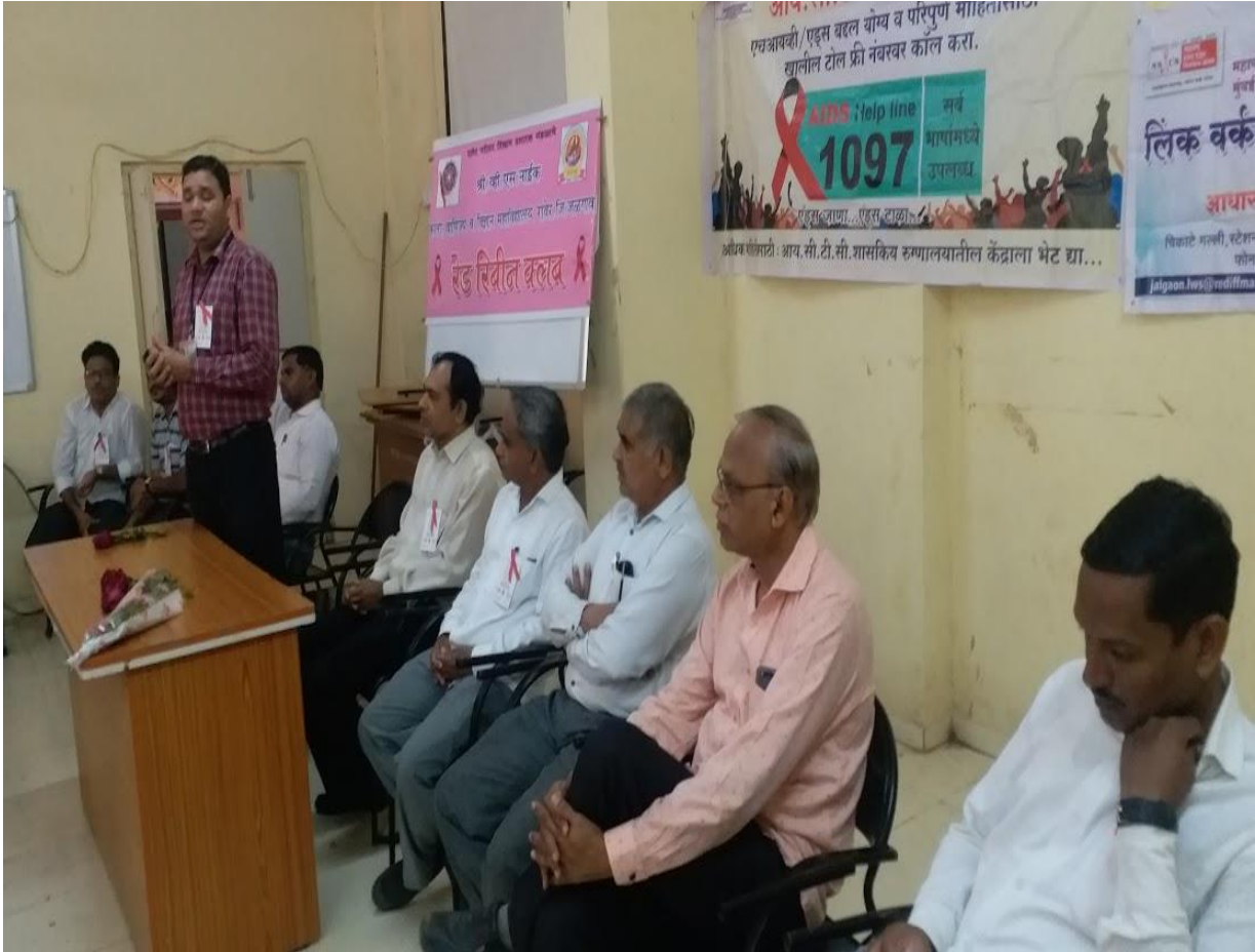
Eminent Personality Giving Information of AIDS