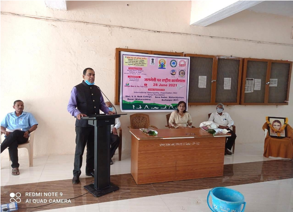
Natinal Level Workshop on Jalneti