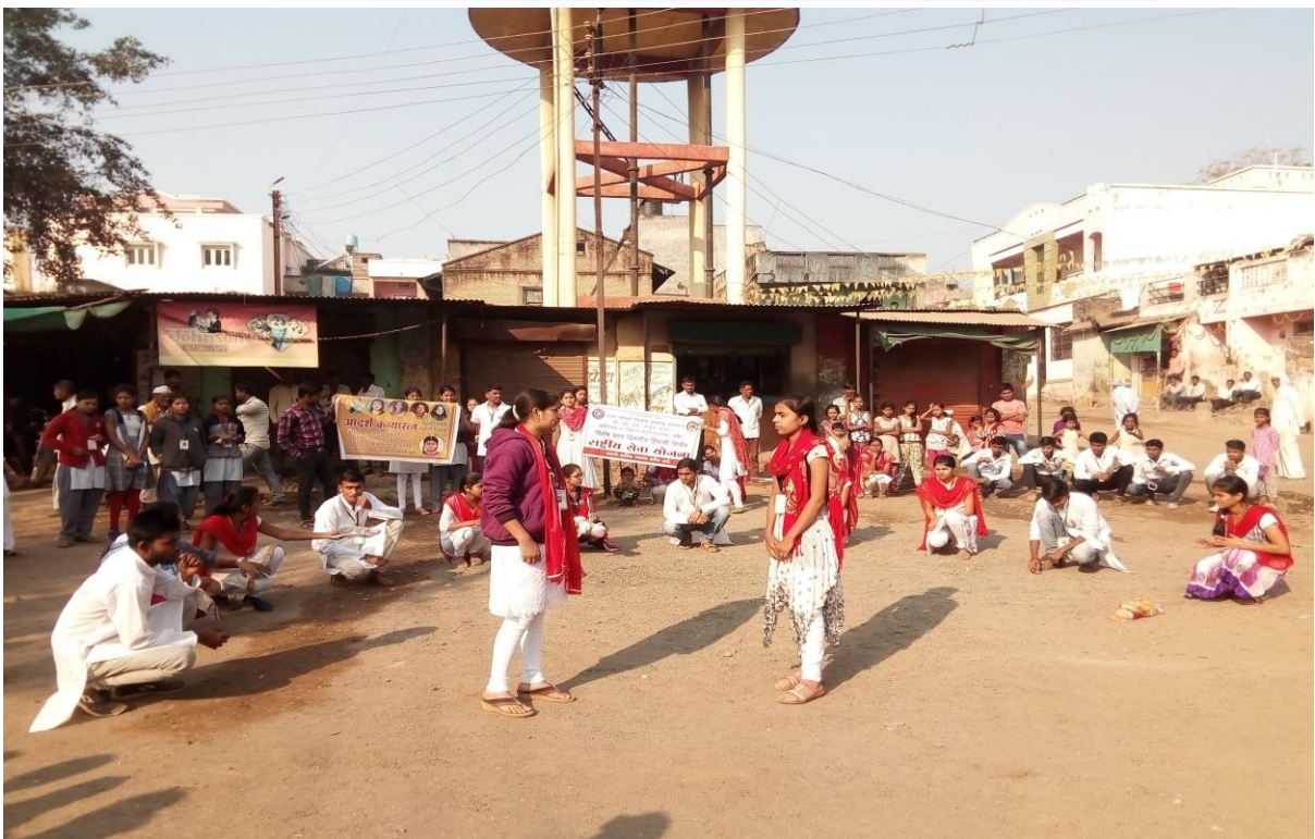
Street play for Save and Educate the Girl Child