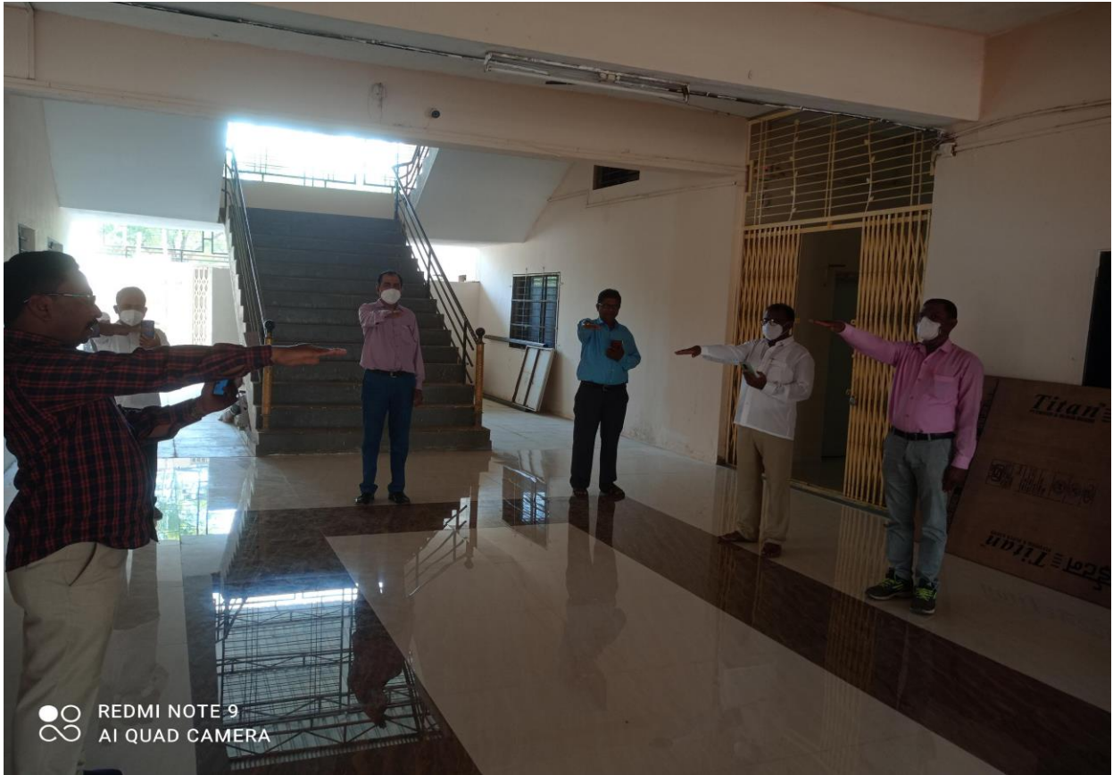
Institute organized Oath Programme on the Occasion of Constitution Day