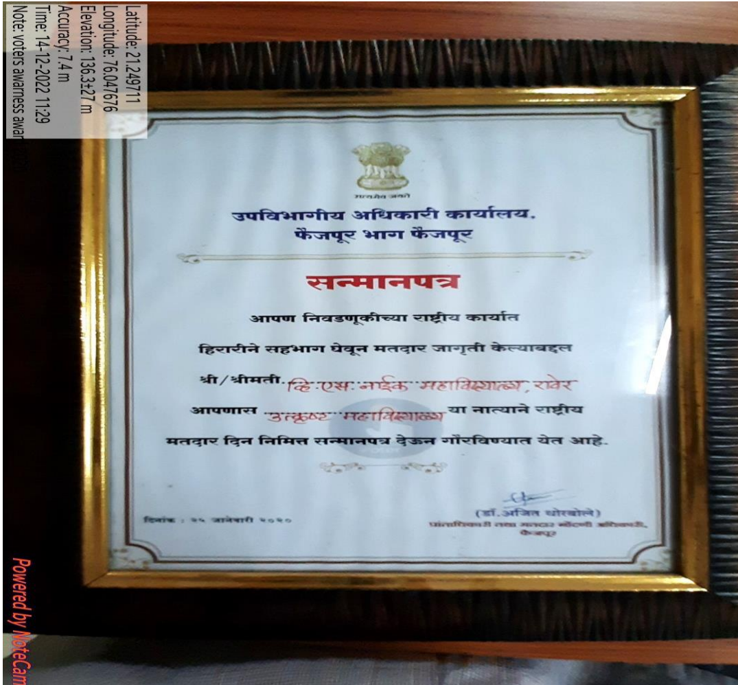
Certificates for to voters awakening