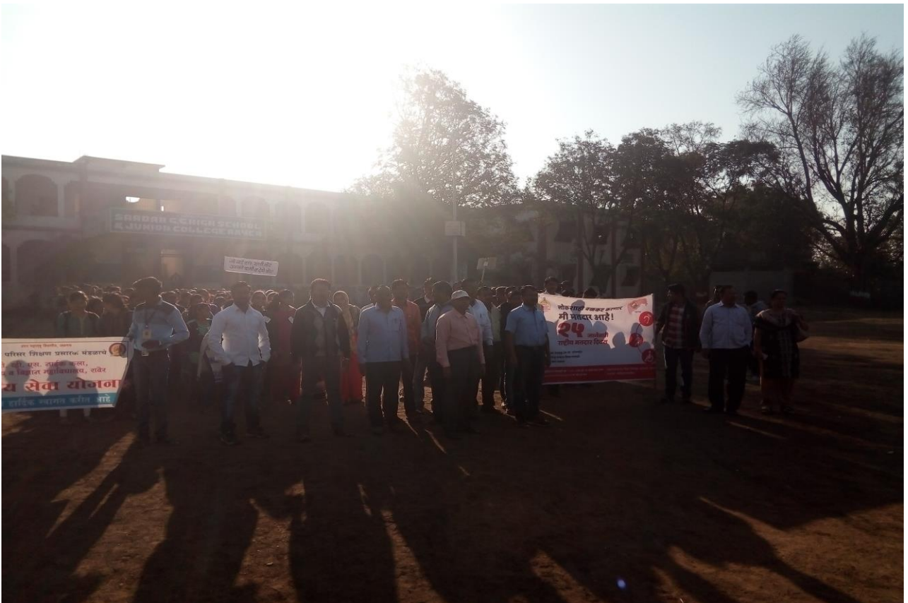
Institute Organized Rally in City to Promote Voter Awareness