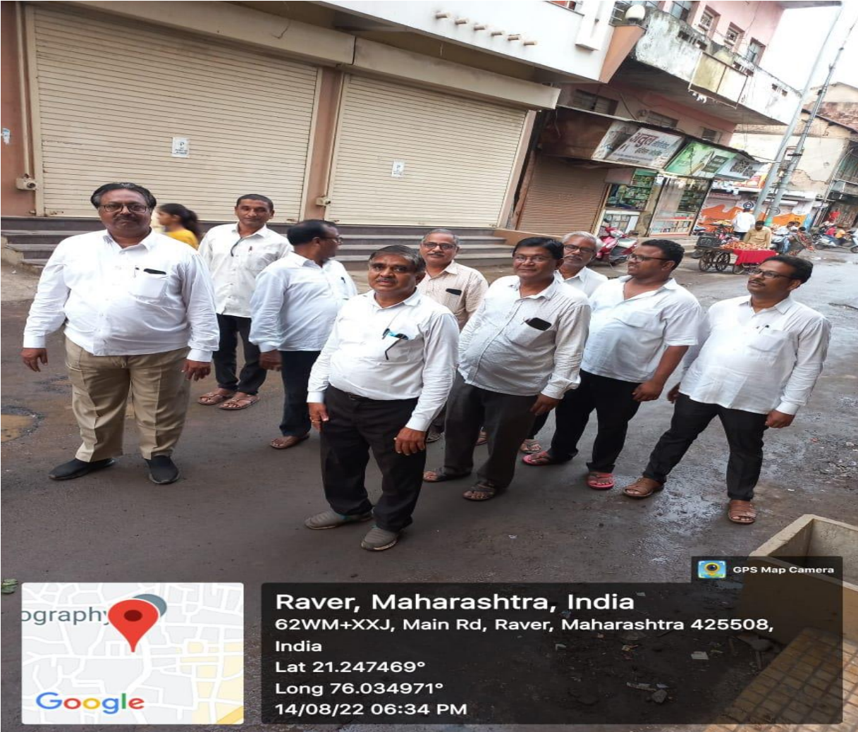
Staff Members in Swarajya Padayatra