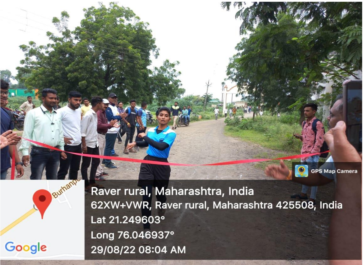
First Runner Female Student in Marathon Competition