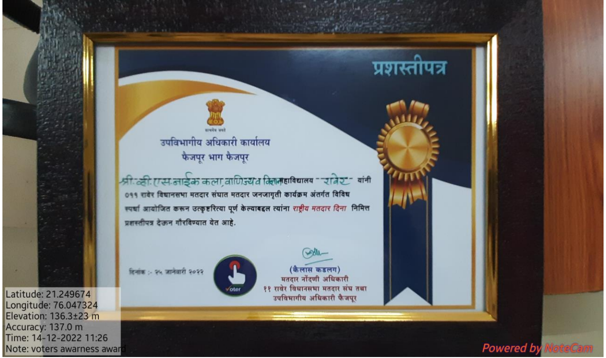
Certificates for to voters awakening