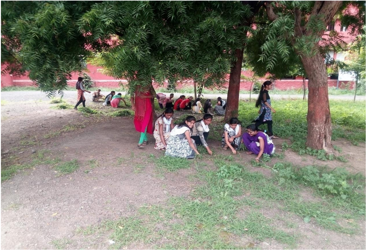
Female Students Participated in Social Activity in the College Premises