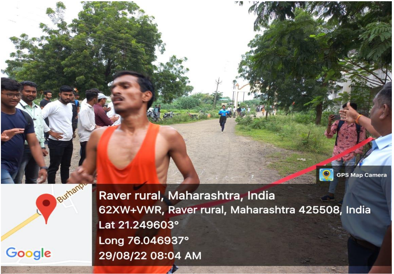
First Runner Male Student in Marathon Competition