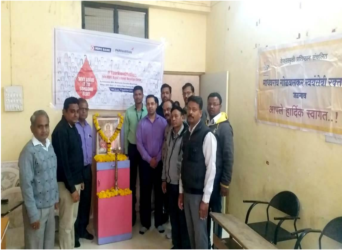
Opening Ceremony of Blood Donation Camp