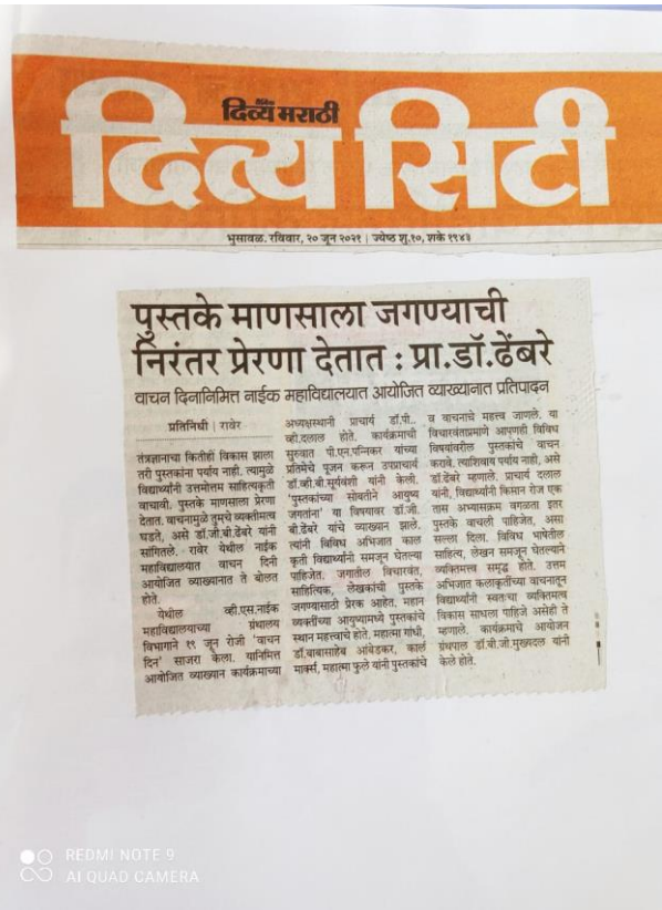
Daily News Paper Cuttings of the Program