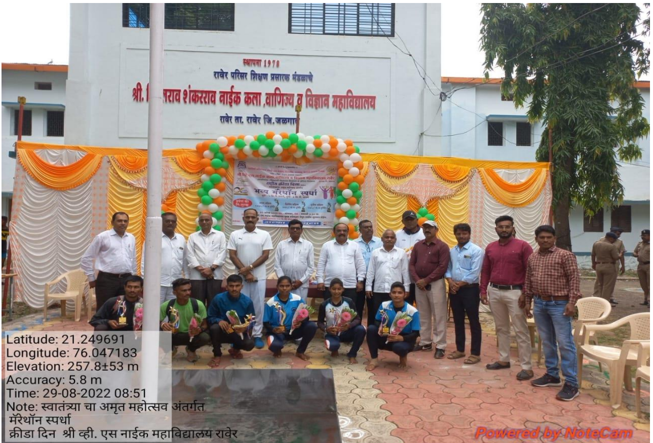
Winner Students in Marathon Competition