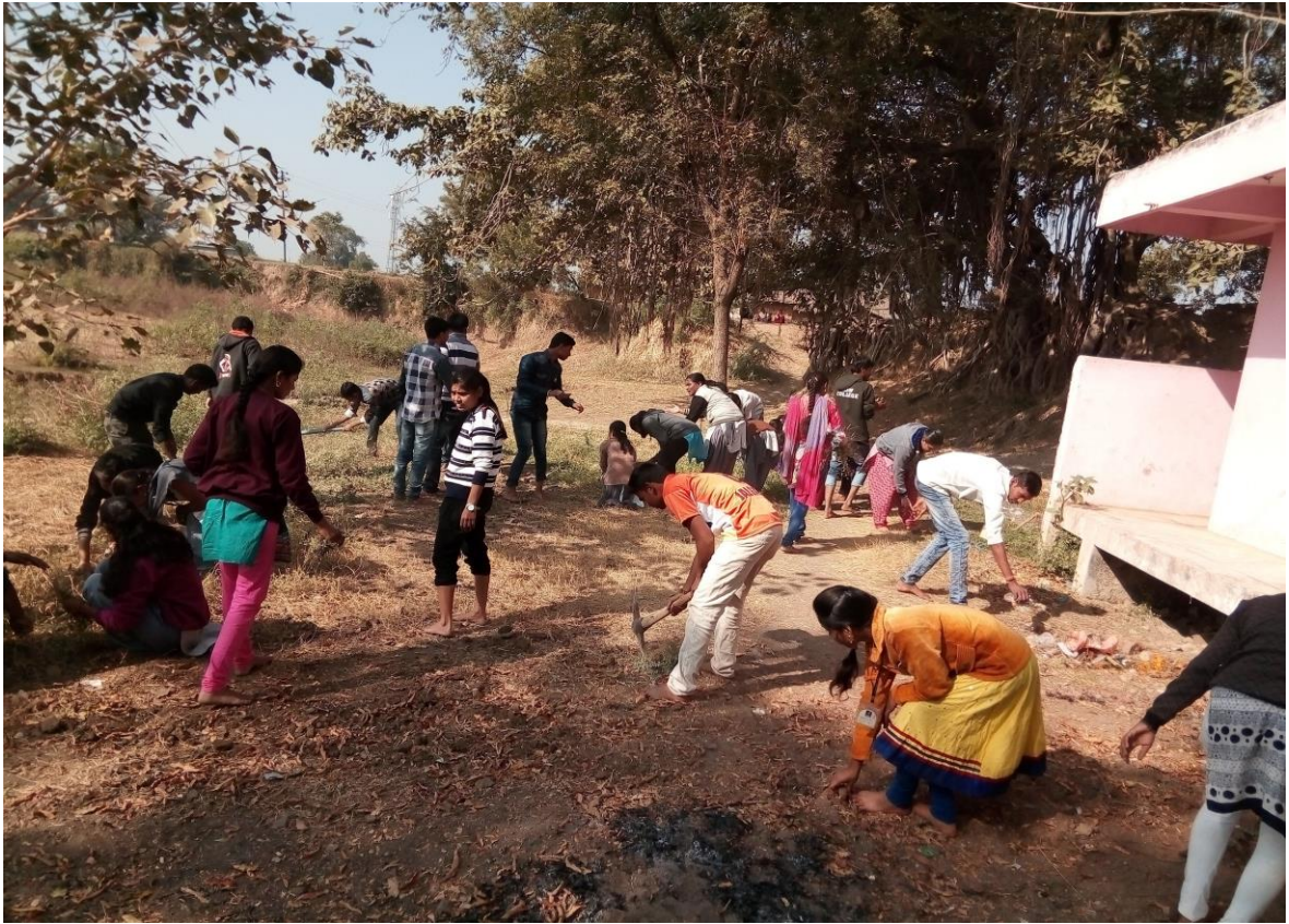
Male and Female Students Participate in Social Activity